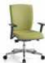
POLE 01 SY