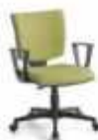
POLE 02 CP