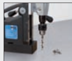
Foret hélicoïdal jusqu'à un diamètre de 13 mm