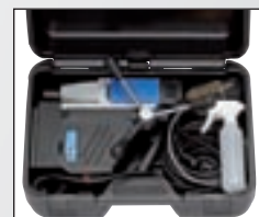
La valise de transport pratique