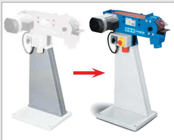
· Socle pour MBSM 100-130 et MBSM 100-130-2 Code article 392 1227 4