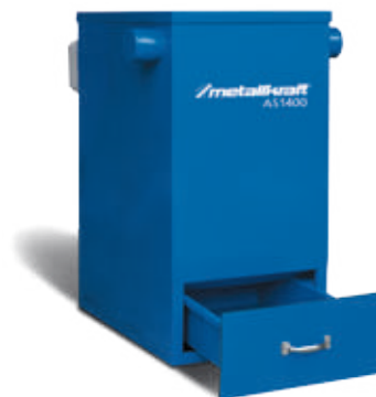
· Kit d'aspiration optionnel AS 1400 pour MBSM 100-130 et MBSM 100-130-2 (plus de détails voir page 407) Code article 392 2011 4