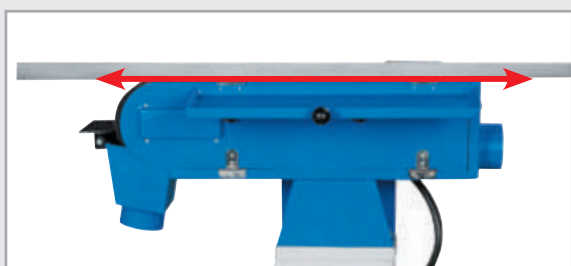
· Butée amovible procurant ainsi une grande surface de travail (permet le ponçage des longues pièces)