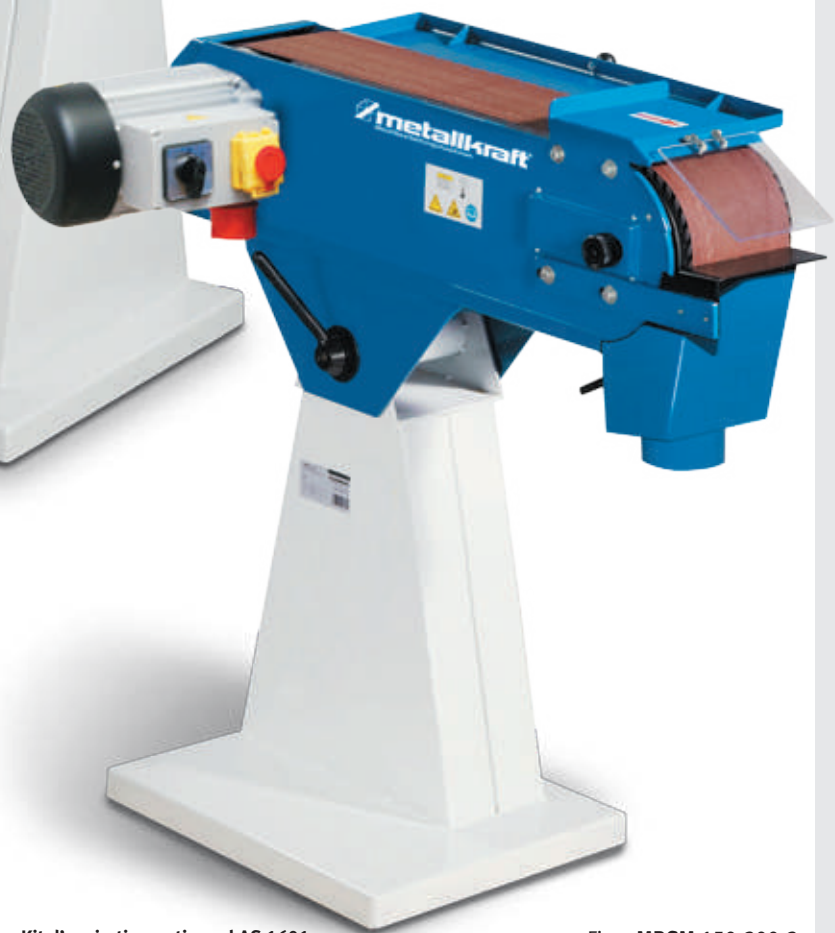
Fig.: MBSM 150-200-2 socle de série