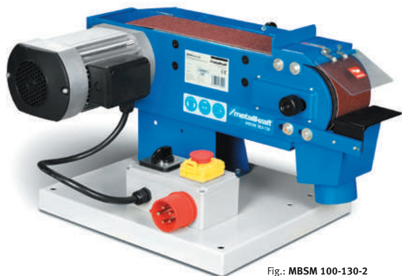
Fig.: MBSM 100-130-2